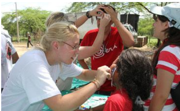
Los niños de Manatí se divirtieron con los voluntarios en esta actividad lúdica.

La jornada fue la antesala de la II Cumbre Mundial del Voluntariado Juvenil que empezó ayer 3 de noviembre.